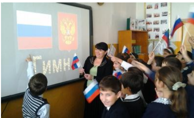
УРОК ПО ОРКСЭ В 4 КЛАССЕ