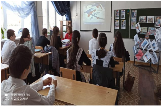
9 «б» кл. Кл.рук.: Мехтиева У.А.(17 обуч.)