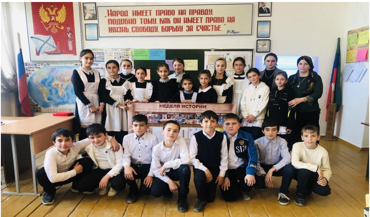
Посещения школьного музея