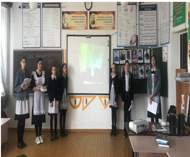
Мероприятие «Герои Отечества» 5 Б кл.- Абдурахманова Д.А.