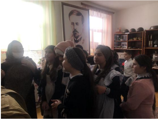
Вечер памяти «Есть такая профессия «Родину защищать!»»