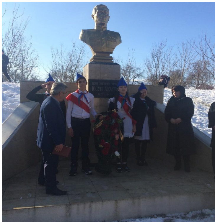
Митинг у памятника Ю.Акаева.