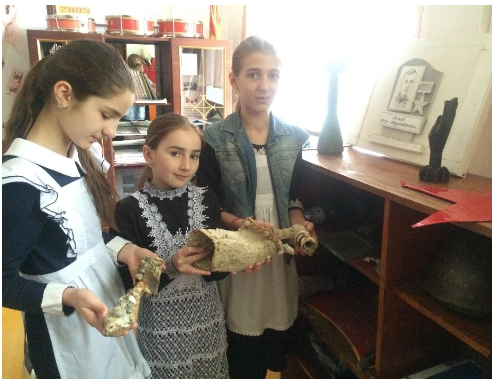
Обломки самолета Героя Советского Союза Ю.Акаева Чопанов М.М.