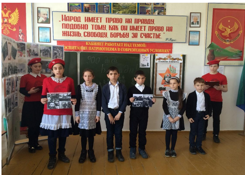
Участие актива музея в мероприятии: «День дагестанской культуры и языка»