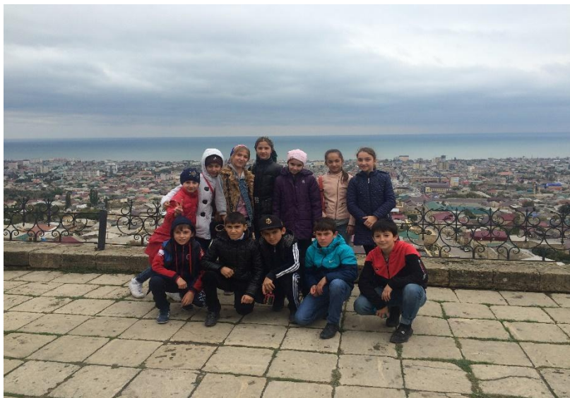
Были проведены экскурсии в Дербент