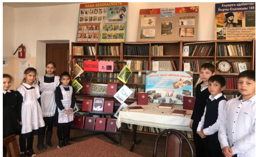
Книжная выставка в школьной библиотеке.