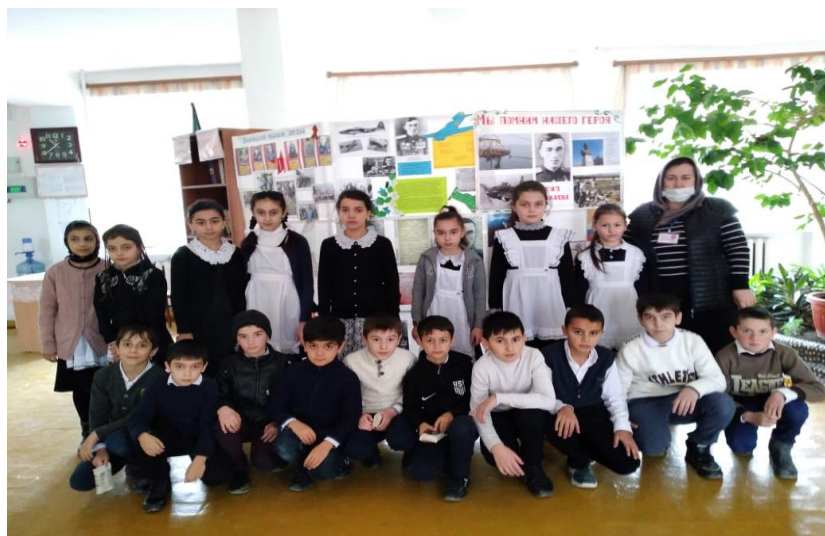
5.12.2020г в фойе школы был оформлен выставка рисунков Дню Героев Отечества