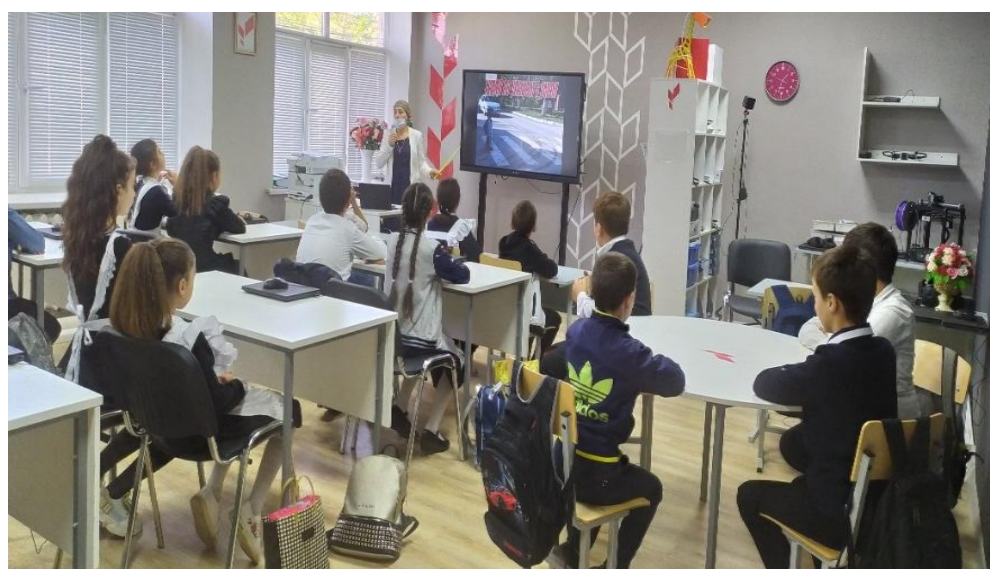
Встреча активистов РДШ с обуч-ся нач.классов