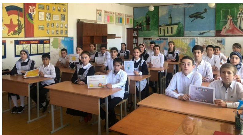
Классный час 9в класса - «Мир полон добрых дел»