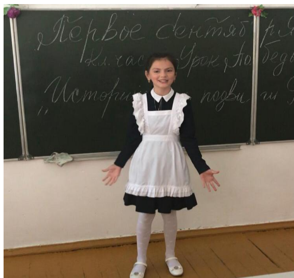
Классный час 5г класса «Исторические подвиги России»