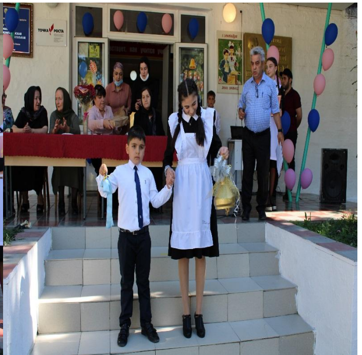
Торжественная линейка, посвящённая Дню Знаний.