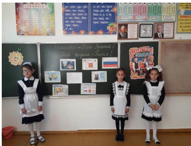
Классный час 2б класса «Моя родина Россия»