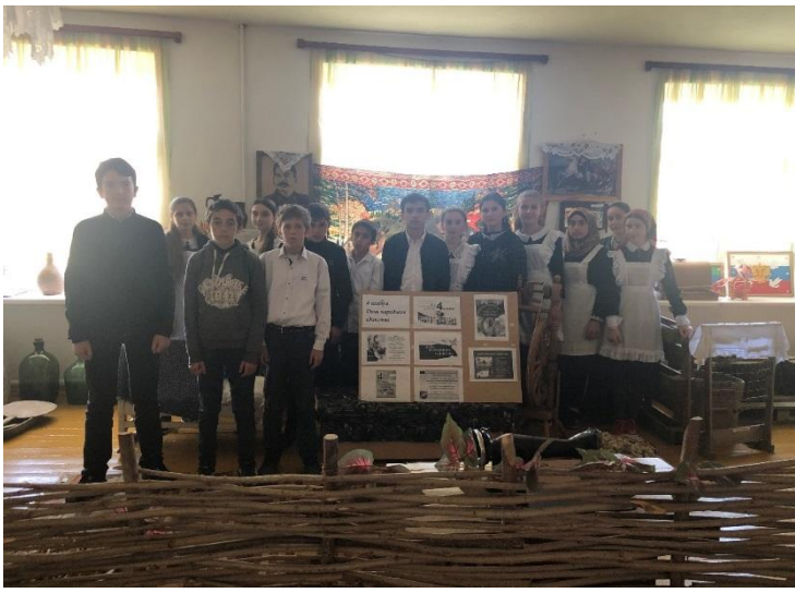
31.10.19г музейный урок в 8 «в» классе «Единством славиться Россия» - Османова Н.Б. (охват 18 обуч.)