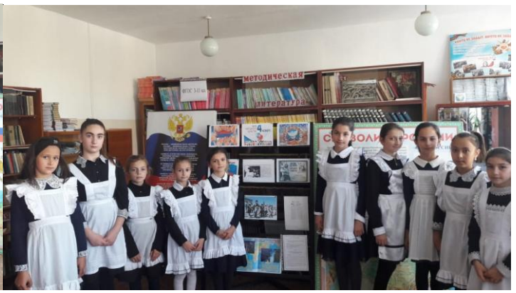
29.10.2019г в школьной библиотеке прошло мероприятие, посвящённое к Дню народного единства (охват 25 обуч.)