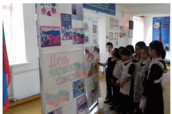
С 26.10.19 в фойе была организована выставка рисунков обучающихся.