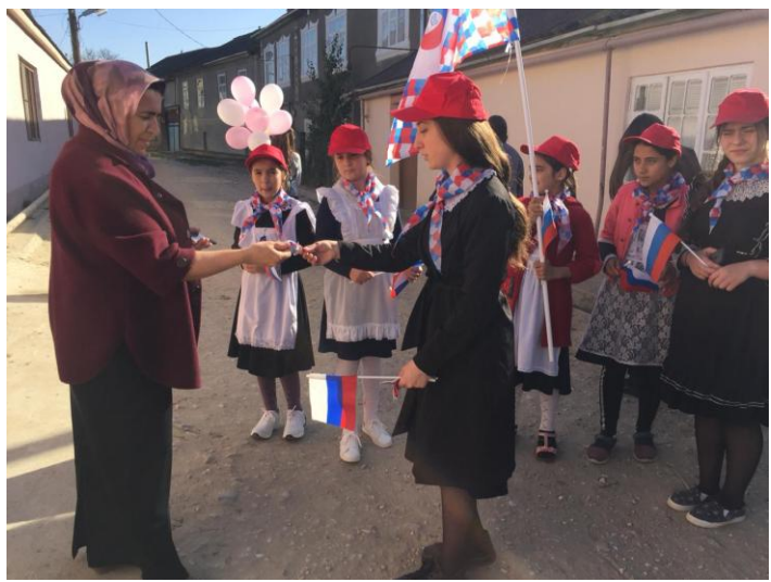
29.10.19г членами волонтерского отряда была организована акция «Я - россиянин!» (охват 15 волонтеров)