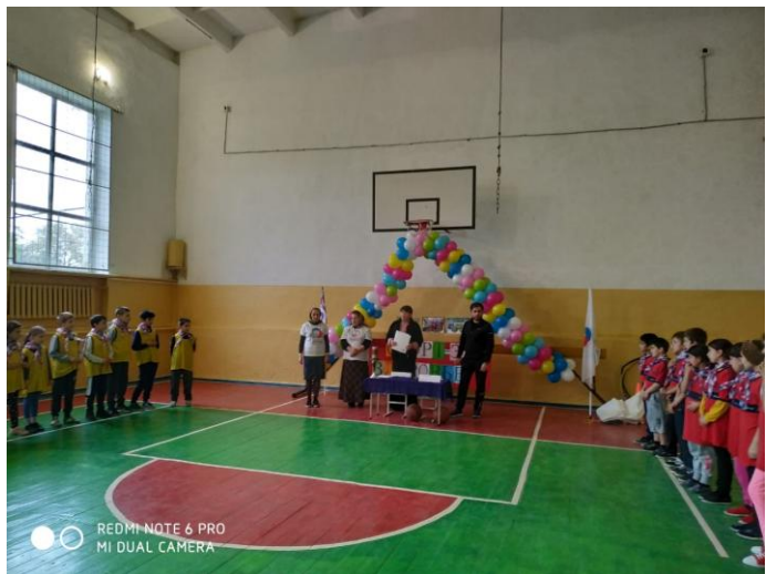
28.10.2019г вожатые, совместно с учителями физкультуры, организовали «Весёлые старты» среди обучающихся 4 классов. (охват 38 обуч.)