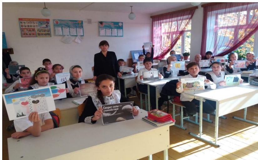
28.10.19г. Урок толерантности ко Дню народного единства «Мы одна страна» в 6 а классе