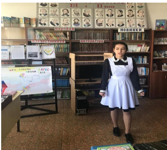
13.09 19г Конкурс чтецов