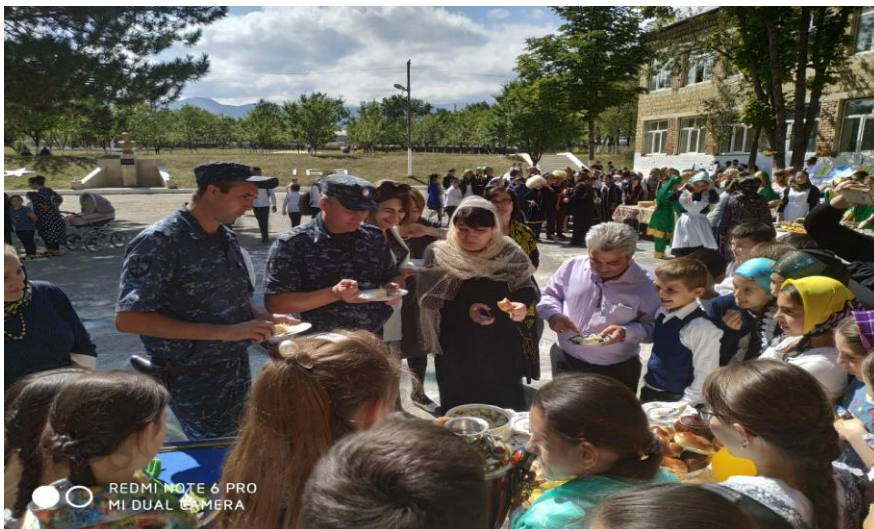
Праздничный майдан «Мой Дагестан» (Охват 650 обуч.)