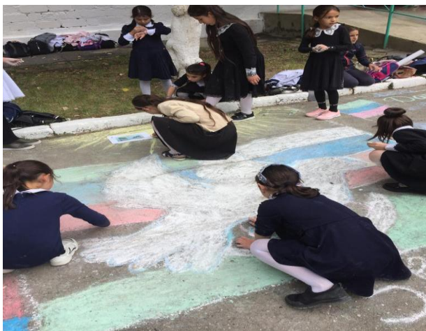
12.09 19г конкурс рисунков на асфальте