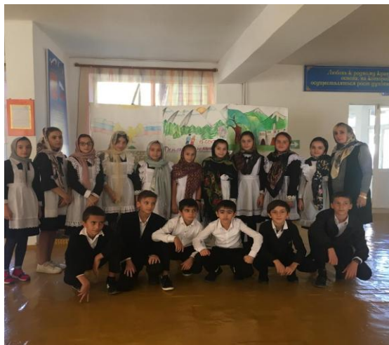
10.09.19г выставка рисунков в файле .